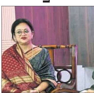
ଯୌନ ନିର୍ଯାତନା ନିରୋଧ ଆଇନ ସଚେତନତା କାର୍ଯ୍ୟକ୍ରମରେ ହାଇକୋର୍ଟ ପୁଷ୍ପା ବିଚାରପତି ହରିଶ ଚଣ୍ଡନ ବକ୍ତବ୍ୟ ରଖୁଛନ୍ତି।

କଟକ,୭୫୪(କାର୍ତ୍ତିକ ସାହୁ) ହାଇକୋର୍ଟରେ କାର୍ଯ୍ୟକ୍ରମ ମହିଳା କର୍ମଚାରୀମାନଙ୍କ ପାଇଁ ଯୌନ ନିର୍ଯାତନା ନିରୋଧ ଆଇନ ସଚେତନତା କାର୍ଯ୍ୟକ୍ରମ ମଙ୍ଗଳବାର ଅନୁଷ୍ଠିତ ହୋଇଯାଇଛି। ଆକ୍ଷ ଅଭିଯୋଗ କମିଟି (ଆଇସିସି) ଦ୍ୱାରା ହାଇକୋର୍ଟ ସମ୍ମିଳନୀ କକ୍ଷରେ ଆୟୋଜିତ ଏହି କାର୍ଯ୍ୟକ୍ରମ ହାଇକୋର୍ଟ ପୁଷ୍ପା ବିଚାରପତି ହରିଶ ଚଣ୍ଡନଙ୍କ ସମେତ ଅନ୍ୟ ବିଚାରପତିମାନେ କର୍ମକ୍ଷେତ୍ରରେ ମହିଳାଙ୍କ ନିରାପତ୍ତା ଓ