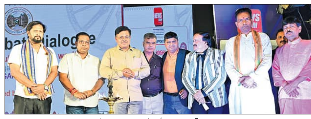
ରେଭେନ୍ସାରେ 'ବାରବାଟୀ ଡାଏଲଗ୍' କାର୍ଯ୍ୟକ୍ରମରେ ଉପସ୍ଥିତ ମନ୍ତ୍ରୀ ଏବଂ ଅନ୍ୟମାନେ।