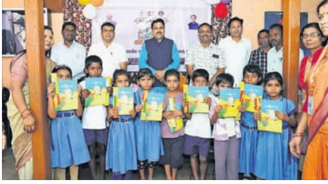
କାର୍ଯ୍ୟକ୍ରମରେ ବିଦ୍ୟାଳୟ ଓ ଗଣଶିକ୍ଷା ମନ୍ତ୍ରୀ ନିତ୍ୟାନନ୍ଦ ଗଣଙ୍କ ସହ ଅନ୍ୟ ଅତିଥି ଏବଂ ଛାତ୍ରାଛାତ୍ରୀ।

ବିଭାଗ ପକ୍ଷରୁ ଓଡ଼ିଆ ପଞ୍ଚ ପାଳନର ସମ୍ପ୍ରଦାୟ ବିଦ୍ୟାଳୟ ମଙ୍ଗଳବାର 'ଶିଶୁକଥା ଦିବସ' ଭାବେ ପାଳନ କରାଯାଇଛି। ଏହି ଅବସରରେ ରାଜ୍ୟର ବିଭିନ୍ନ ପ୍ରାଥମିକ ବିଦ୍ୟାଳୟରେ ଛାତ୍ରାଛାତ୍ରୀଙ୍କୁ 'ବର୍ଣ୍ଣବୋଧ' ଓ 'ଶିଶୁଲେଖା' ପୁସ୍ତକ ବଣ୍ଟନ କରାଯିବ। ସ୍ୱାଗତଯୋଗ୍ୟ ପଦକ୍ଷେପ ବୋଲି ମନ୍ତ୍ରୀ ଗଣ କହିଥିଲେ। ରାଜ୍ୟର ବିଭିନ୍ନ ସରକାରୀ ବିଦ୍ୟାଳୟ, ବେସରକାରୀ ଏବଂ ସ୍ୱେଚ୍ଛାସେବୀ ବିଦ୍ୟାଳୟରେ ଶିଶୁକଥା ଦିବସ ପାଳନ କରାଯାଇଛି। ଓଡ଼ିଆ ଭାଷା ଓ ସାହିତ୍ୟର ପ୍ରଚାର ପ୍ରସାର ସହ ଓଡ଼ିଆ ସଂସ୍କୃତି, ପରମ୍ପରା ଏବଂ ବିଭିନ୍ନ ଲୋକବାଣୀ ସମ୍ବନ୍ଧରେ ଯେପରି ଛାତ୍ରାଛାତ୍ରୀମାନେ ଅବଗତ ହୋଇପାରିବେ ତାହା ଏହି କାର୍ଯ୍ୟକ୍ରମର ମୁଖ୍ୟ ଉଦ୍ଦେଶ୍ୟ ବୋଲି ବିଭାଗ ପକ୍ଷରୁ ସୂଚନା ଦିଆଯାଇଛି।