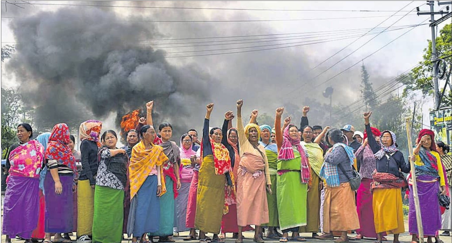
ମଣିପୁର ବିଷୁପୁରରେ ବୋମାମାଡ଼ରେ ୨ ଶିଶୁଙ୍କ ମୃତ୍ୟୁ ଘଟିବା ପରେ ଲୋକେ ରାସ୍ତା ଅବରୋଧ କରି ବିକ୍ଷୋଭ ପ୍ରଦର୍ଶନ କରୁଛନ୍ତି।

୩୪୫ଟି ପ୍ରକଳ୍ପକୁ ଅନୁମୋଦନ କରାଯାଇଛି। ଏଥିମଧ୍ୟରୁ ୯୯ଟି ପ୍ରକଳ୍ପ ସମ୍ପୂର୍ଣ୍ଣ ହୋଇଥିବାବେଳେ ଅନ୍ୟଗୁଡ଼ିକର କାର୍ଯ୍ୟ ଜାରି ରହିଛି। ଆର୍ଥିକ ପରିଚାଳନା କ୍ଷେତ୍ରରେ ମଧ୍ୟ ଓଡ଼ିଶା ଉନ୍ନତ ପ୍ରଦର୍ଶନ ସହ ଅନୁଦାନ ଅର୍ଥ ଠିକ୍ ଭାବେ ବିନିଯୋଗ କରିବାରେ ସଫଳ ହୋଇଛି। ଅମୃତ ୨.୦ କ୍ରିୟାରେ ରାଜ୍ୟର ଜଳ ଭିତ୍ତିଭୂମି ସୁଦୃଢ଼ କରାଯାଇଛି। ୭ଟି ଜଳ ବିଶୋଧନ ପ୍ଲାଣ୍ଟ ମାଧ୍ୟମରେ ବୈଦିକ ୪୩୩ ଏମ୍.ଏଲ୍.ଡି ଜଳ ବିଶୋଧନ କ୍ଷମତା ସୃଷ୍ଟି କରାଯାଇଛି। ଏହାସହ ପ୍ରାୟ ୨.୮୩ ଲକ୍ଷ ନାଗରିକ ଉପକୃତ ହୋଇଛନ୍ତି। ପ୍ରମୁଖ ସହରଗୁଡ଼ିକରେ ୨୪x୭ ଜଳଯୋଗାଣ ବ୍ୟବସ୍ଥା ସୁନିଶ୍ଚିତ ହେବା ପୃଷ୍ଠା-୧୧