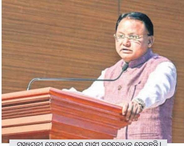
ମୁଖ୍ୟମନ୍ତ୍ରୀ ମୋହନ ଚରଣ ମାଝୀ ଉଦ୍‌ବୋଧନ ଦେଉଛନ୍ତି।