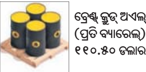
ଦ୍ରୋଣ କୁଡ଼ି ଅଏଲ (ପ୍ରତି ବ୍ୟାଲେଟ୍) ୧୧୦.୫୦ ଡଲାର