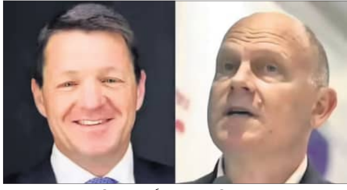
ପିତର ଏଲବର୍ସ ଓ କ୍ୟାମ୍ପବେଲ୍ ଫ୍ଲାଇସନ

ଏୟାର ଇଣ୍ଡିଆ ମୁଖ୍ୟ କାର୍ଯ୍ୟନିର୍ବାହୀ ଅଧିକାରୀ ତଥା ପରିଚାଳନା ନିର୍ଦ୍ଦେଶକ କ୍ୟାମ୍ପବେଲ୍ ଫ୍ଲାଇସନ ଟାଙ୍କ ପଦବୀରୁ ଇସ୍ତଫା ଦେଇଛନ୍ତି। ତାଙ୍କ ଇସ୍ତଫା ଦେଖିବା ପରେ ଇଣ୍ଡିଆ ମଙ୍ଗଳବାର ନିଷ୍ପତ୍ତି କରିଛି। ଏୟାର ଇଣ୍ଡିଆ ମଙ୍ଗଳବାର ନିଷ୍ପତ୍ତି କରିଛି। ଏୟାର ଇଣ୍ଡିଆର ପରବର୍ତ୍ତୀ ସିଇଓ ନିଯୁକ୍ତି ପର୍ଯ୍ୟନ୍ତ କ୍ୟାମ୍ପବେଲ୍ ଟାଙ୍କ ଘାତରେ କାର୍ଯ୍ୟ କରିବେ ବୋଲି କୁହାଯାଇଛି। ତେବେ ସ୍ୱଳ୍ପ ବ୍ୟବଧାନରେ ଭାରତର ୨ ବୃହତ୍ ଏୟାରଲାଇନ୍ସର ସିଇଓଙ୍କ ଇସ୍ତଫା ଭାରତୀୟ ବେସାମରିକ ବିମାନ ଚଳାଚଳ କ୍ଷେତ୍ର ପ୍ରତି ବଡ଼ ଆହ୍ୱାନ ସୃଷ୍ଟି କରିଛି। ୨୦୨୨ରେ ଏୟାର ଇଣ୍ଡିଆର ପରବର୍ତ୍ତୀ ସିଇଓଙ୍କୁ ନିଯୁକ୍ତ କରିବା ପରେ ଏହା ଗୋଟିଏ ବଡ଼ ସମ୍ପର୍କ ଯାଇଥିଲା ଏବଂ କ୍ୟାମ୍ପବେଲ୍ ଏହାର ସିଇଓ ଭାବେ ନିଯୁକ୍ତ ହୋଇଥିଲେ। ଏୟାର ଇଣ୍ଡିଆର ସମ୍ପ୍ରସାରଣ ଏବଂ ଗାତାୟ ତଥା ଅନ୍ତର୍ଜାତୀୟ ରୁଟ୍‌ରେ ଯାତ୍ରାମାନଙ୍କୁ ଉତ୍ତମ ସେବା ଯୋଗାଇଦେବାକୁ କ୍ୟାମ୍ପବେଲ୍ଙ୍କ ନେତୃତ୍ୱ ଖୋରାକ ଯୋଗାଇବ ବୋଲି କୁହାଯାଇଥିଲା। କିନ୍ତୁ ୨୦୨୨ ପରେ ବିଭିନ୍ନ ଘଟଣାକୁ ନେଇ ଏୟାର ଇଣ୍ଡିଆର କ୍ଷତିବୃଦ୍ଧି ହୋଇଛି। ଗତବର୍ଷ ଅହମମାଦାବଦ୍ କଂଗ୍ରେସ୍ ମାଉଥିବା ଏୟାର ଇଣ୍ଡିଆର ଏକ ବିମାନ ଉଡ଼ାଣ ଭରିବାର ମାତ୍ର କିଛି ମୁହୂର୍ତ୍ତ ପରେ ଦୁର୍ଘଟଣାଗ୍ରସ୍ତ ହୋଇ