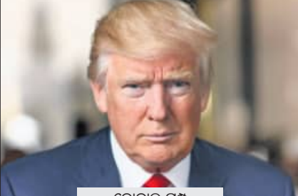
ଡୋନାଲ୍ଡ ଟ୍ରମ୍ପ, ଓଡ଼ିଶା, ୭/୪

ଭରାନ ମୁକ୍ତିଚିତ୍ତ ଭିଲ୍ ନ କରିବା ଏବଂ ସ୍ତେର୍ ଅଫ୍ ହର୍ମ୍ସକୁ ନ ଖୋଲିବାର ଭୟାନକ ପରିଣାମ ହେବାକୁ ଯାଉଛି। ଦିବସ ଶେଷ ସୁଦ୍ଧା ଭରାନ ସଭ୍ୟତା ସମ୍ପୂର୍ଣ୍ଣ ଲୋପ ପାଇଯାଇପାରେ ବୋଲି ଆମରିକା ରାଷ୍ଟ୍ରପତି ଡୋନାଲ୍ଡ ଟ୍ରମ୍ପ ରୂପ ସୋସିଆଲ୍ରେ ଲେଖିଛନ୍ତି। ସେ ଲେଖିଛନ୍ତି, ମଙ୍ଗଳବାର ରାତିରେ ସମ୍ପୂର୍ଣ୍ଣ ସଭ୍ୟତା ମରିଯିବ ଓ ଆଉ କେବେ ଫେରିବ ନାହିଁ। ତେବେ ସେ ତାହା ହେବାକୁ ଚାହୁଁ ନାହାନ୍ତି, କିନ୍ତୁ ସମ୍ଭବତଃ ଘଟିବାକୁ ଯାଉଛି ବୋଲି କହିଛନ୍ତି। ସ୍ଥିତିକୁ ଦେଖି ଶେଷ ମୁହୂର୍ତ୍ତରେ ଆକ୍ରମଣକୁ ସ୍ଥଗିତ ରଖାଯାଇପାରେ। ବିଶ୍ୱର ଦୀର୍ଘ ତଥା ଛତିଳ ଇତିହାସରେ ମଙ୍ଗଳବାର ରାତି ଅତ୍ୟନ୍ତ ଗୁରୁତ୍ୱପୂର୍ଣ୍ଣ ମୁହୂର୍ତ୍ତ ବୋଲି ଟ୍ରମ୍ପ କହିଛନ୍ତି। ଭରାନର ସମ୍ପୂର୍ଣ୍ଣ ସଭ୍ୟତାକୁ ଧ୍ୟ କରିଦେବା ପାଇଁ ଟ୍ରମ୍ପ ଧମକ ଦେବା ଏବଂ ଆମେରିକା ପୂର୍ବରୁ କେବେ ବ୍ୟବହାର କରି ନ ଥିବା ଅସ୍ତ୍ର ଉପଯୋଗ କରିବା ବୋଲି ଉପରାଷ୍ଟ୍ରପତି ଜେ.ଡି. ଭାନୁ କହିବା ପରେ ଭରାନ ବିରୋଧରେ ଆମେରିକା ପରମାଣୁ ଅସ୍ତ୍ର ବ୍ୟବହାର କରିବା ନେଇ କଳ୍ପନାକଳ୍ପନା ପ୍ରକାଶ ପାଇଛି। ସୋସିଆଲ ମିଡିଆରେ ଏହାକୁ ନେଇ ଚର୍ଚ୍ଚା ଜୋର୍ ଧରିବା ପରେ ହାଇଲ୍ଡ ହାଇଲ୍ ପକ୍ଷରୁ ୧୬୫-୪