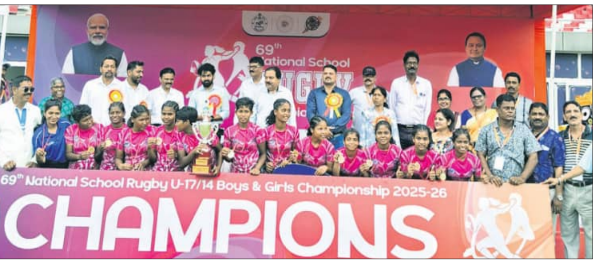
ବାଳିକା ବିଭାଗରେ ଓଡ଼ିଶା ଦଳର ଖେଳାଳିମାନେ ଟ୍ରଫି ସହ ଅତିଥିଙ୍କ ଗହଣରେ।

ଭୁବନେଶ୍ୱର, ୭।୪ (ତପନ ସାହୁ) କଳିଙ୍ଗ ଷ୍ଟାଡ଼ିୟମରେ ୧୭ ବର୍ଷରୁ କମ୍ ଲାଗଣା ବିଦ୍ୟାଳୟ ସମୂହ (ଏସ୍‌ସିଏସ୍‌ଆଇ) ରତନା ଚାମ୍ପିୟନଶିପ୍ ମଙ୍ଗଳବାର ଶେଷ ହୋଇଛି। ଏହାର ବାଳିକା ବର୍ଗରେ ଓଡ଼ିଶା ଚାମ୍ପିୟନ ହୋଇଥିବାବେଳେ ବାଳକରେ ବିହାର ଚାମ୍ପିୟନ ହୋଇଥିବା ଦିଆଯାଇଛି।