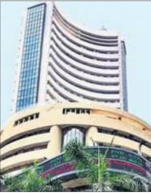
ବିଏସ୍‌ଏସ୍‌ଏସ୍‌ଏସ୍ ୭୪, ୭୧୧.୫୮ (+୫୦୯.୭୩)

ନିୟନ୍ତ୍ରଣରେ ରଖିବା ଉଚିତ୍ ହୋଇପାରେ। ସମସ୍ତ ବିଷୟକୁ ବିଚାରକୁ ନେଇ ଏମ୍‌ସିଆଇ ଆଭିମୁଖ୍ୟ ଗ୍ରହଣ କରୁଛନ୍ତି ତାହା ଉପରେ ସମସ୍ତଙ୍କ ନଜର ରହିଛି। ରେପୋକୁ ନେଇ ଉଲ୍ଲ୍ଲାସ ଲାଗି ରହିଛି। ଚଳିତ ବର୍ଷ ପ୍ରଥମ ଦ୍ୱିମାସିକ ଦେଠକରେ ଆର୍ବିଆଇ ରେପୋ ହାର ଅପରିବର୍ତ୍ତିତ ରଖିଥିଲାବେଳେ ବର୍ତ୍ତମାନ ଏହା ୫.୨୫ % ରହିଛି। ୨୦୨୫ରେ ଫୁଲ ହାରରେ ୨.୫ ବେସିଏ ପଦକ୍ଷେପ କରାଯାଇଥିଲାବେଳେ ଏଥିରେ ପରବର୍ତ୍ତୀ ସମୟରେ କୌଣସି ପରିବର୍ତ୍ତନ କରା ନଯାଇ ଅପରିବର୍ତ୍ତିତ ରଖାଯାଇଥିଲା।