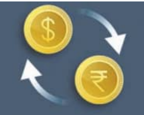
୧ ଡଲାର = ୯୨.୮୬ ଟଙ୍କା