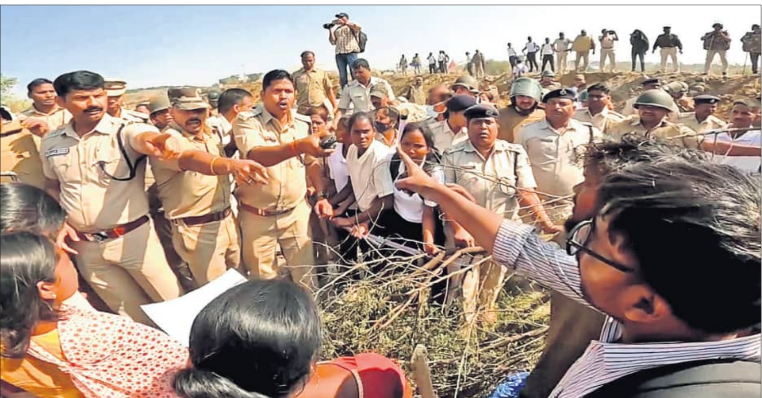
ରାୟଗଡ଼ା ଜିଲ୍ଲା ଶାନ୍ତବାରି ଗ୍ରାମରେ ମଙ୍ଗଳବାର ପୋଲିସ୍ ଓ ଗ୍ରାମବାସୀ ମୁହାଁମୁହିଁ ହୋଇଛନ୍ତି।

ଅନେକ ଖୁସି ଭାବି କରାଯାଇଛି। ବର୍ଷା ସମୟରେ ୫୦ରୁ ୬୦ କି.ମି. ବେଗରେ ପବନ ବୋହିବା ସମ୍ଭାବନା ଥିବାରୁ ଏହି ସମୟରେ ଆବଶ୍ୟକ ନ ପଡ଼ିଲେ ଘରୁ ନ ବାହାରିବାକୁ ପରାମର୍ଶ ଦିଆଯାଇଛି। ସେହିପରି ବାଲେଶ୍ୱର, ଭଦ୍ରକ, କେନ୍ଦ୍ରାପଡ଼ା, କଟକ, ଜଗତସିଂହପୁର, ପୁରୀ, ଖୋର୍ଦ୍ଧା, ନୟାଗଡ଼, ଗଞ୍ଜାମ, ଗଜପତି, ୧୬୫-୪