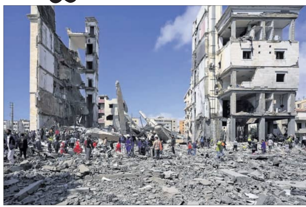
ଇରାନର ସାଲ୍ମାସ୍ତାରେ ଇସ୍ତ୍ରାଏଲ୍ ପକ୍ଷରୁ ବୁଧବାର ଏହାର ସ୍ତ୍ରୀଲଙ୍କ ପରେ ଉଗ୍ରାବଶେଷକୁ ଉଦ୍ଧାର କାର୍ଯ୍ୟ ଜାରି ରହିଛି ।

■ ଯୁଦ୍ଧ, କୁସର୍, ବାହାରିନ୍ରେ ଆକ୍ରମଣ ଜାରି ■ ହେଜ୍ ବୋଲାକୁ ଇସ୍ତ୍ରାଏଲ୍ ଟାର୍ଗେଟ୍