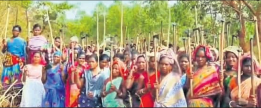
ସିଦ୍ଧିପାଳି ପାହାଡ଼ର ସୁରକ୍ଷା ପାଇଁ ରୁଧିରୀ ଆଦିବାସୀ ମହିଳାମାନେ ପାରମ୍ପରିକ ଅସ୍ତ୍ରଶସ୍ତ୍ର ସହିତ ଏକାଠି ହୋଇଛନ୍ତି ।

ବେଦାନ୍ତ ପାଇଁ ଲୋକଙ୍କୁ ଦମନ ଘଟଣା ପରିଚ୍ଛେଦ ବେଦାନ୍ତକୁ ସିଦ୍ଧିପାଳି ପାହାଡ଼ ଦେଖୁନାହିଁ : ଗ୍ରାମବାସୀ