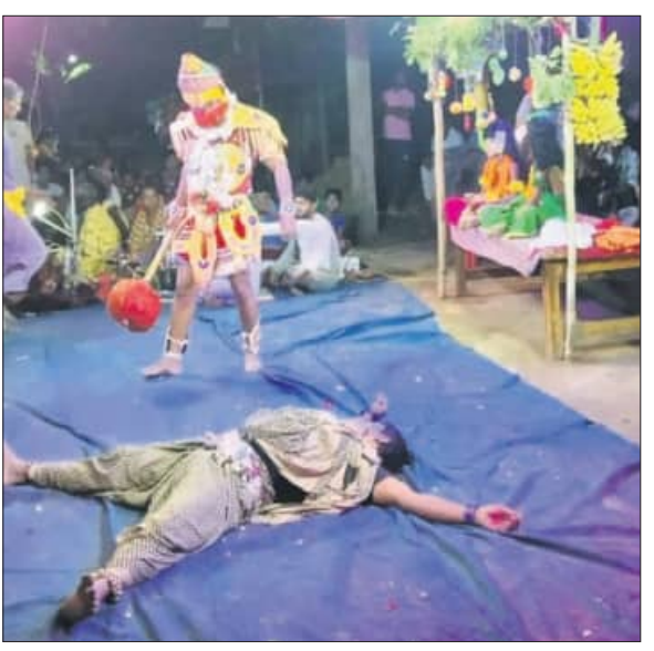
ଚମ୍ପାଲୋକରେ 'ସୀତାଚୋରି' ଓ କପାସିଆ ଗ୍ରାମରେ 'ଲଙ୍କାପୋଡ଼ି' ନାଟକର ଦୃଶ୍ୟ।