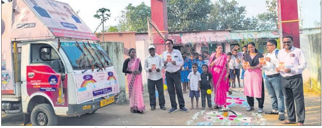
ତମ୍ପାଲୋକ ବିଦ୍ୟାଳୟ ପରିସରରେ ଶିକ୍ଷା ସଚେତନତା ରଥକୁ ସ୍ୱାଗତ କରାଯାଇଛି।