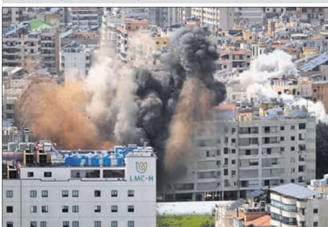
ବିରୁଦ୍ଧରେ ଇସ୍ରାଏଲ୍‌ର ଘନଘନ ଏୟାର ଷ୍ଟ୍ରାଇକ୍ ପରେ କୋଠାଗୁଡ଼ିକରୁ ଧୂଆଁ ଉଠୁଛି ।

ବିରୁଦ୍ଧରେ ଇସ୍ରାଏଲ୍‌ର ଘନଘନ ଏୟାର ଷ୍ଟ୍ରାଇକ୍ ପରେ କୋଠାଗୁଡ଼ିକରୁ ଧୂଆଁ ଉଠୁଛି । ସିଇସିଙ୍କୁ କହିଥିଲେ । କିଛି ଇସ୍ରାଏଲୀ ସେନା ବିରୁଦ୍ଧ ଦକ୍ଷିଣ ଲେବାନନ୍ ଓ ବେକା ଉପତ୍ୟକାରେ ଥିବା ହେକ୍‌ବୋଲାର ଶତାଧିକ ଅଞ୍ଚଳ ମାତ୍ର ୧୦ ମିନିଟ୍‌ରେ ଆକ୍ରମଣ କରି ଧସିଯିବାକୁ କରିଦେଇଛି । ଏହା ପରେ ଲେବାନନ୍‌ରେ ଆତଙ୍କର ବାତାବରଣ ସୃଷ୍ଟି ହୋଇଛି । ବୁଧବାର ଅପରାହ୍ନରେ ବହୁ ସଂଖ୍ୟକ ଆବାସିକଙ୍କୁ ବିଧିବଦ୍ଧ ହୋଇଯାଇଥିବାବେଳେ ବିଭିନ୍ନ ସ୍ଥାନରେ ଅଗ୍ନିକୁଣ୍ଡ କରିବାକୁ ମନା କରିଦେଇଛି ।