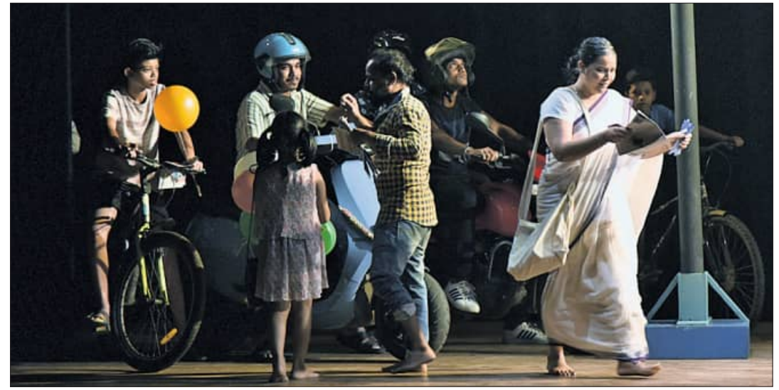
ସାଙ୍ଗସାଥୀ ଥିବା ପକ୍ଷର ପକ୍ଷର ମଞ୍ଚକୁ ନାଟକ 'ବୋଉଲୋ' ଏକ ଦୃଶ୍ୟ।