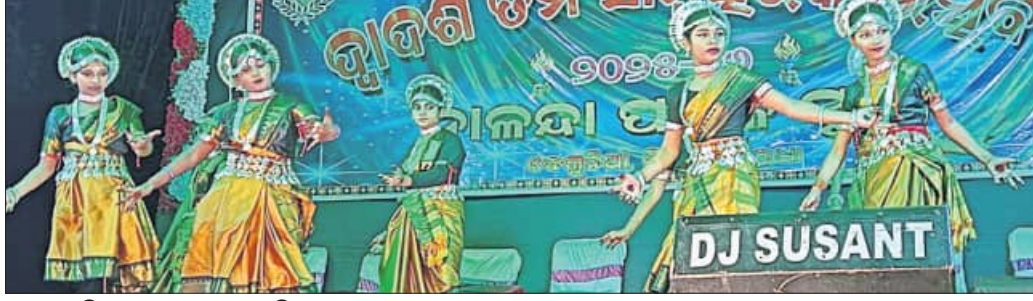
ବେଗୁନିଆ, ୮୪