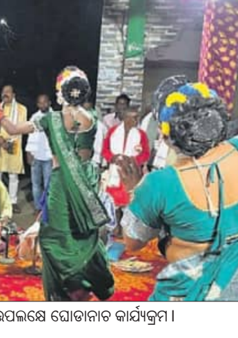
ଈଶା ଗ୍ରାମରେ ବାସେଲି ପୂଜା ଉପଲକ୍ଷେ ଘୋଡ଼ାନାଚ କାର୍ଯ୍ୟକ୍ରମ।

ସାମାଜିକ ଅନୁଷ୍ଠାନ ହେଲ୍ଡମେଣ୍ଟ୍, ସ୍ୱୟମ୍, ସ୍ୱାଧୀନ ଫାଉଣ୍ଡେଶନ ଏବଂ କମିଶନରଙ୍କ ପୋଲିସ ପକ୍ଷରୁ ରକ୍ତଦାନ ଶିବିର କୁସୁଧାର ଭାବେ କାର୍ଯ୍ୟକାରୀରେ ଅନୁଷ୍ଠିତ ହୋଇଯାଇଛି।