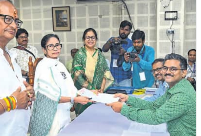
ପଶ୍ଚିମବଙ୍ଗ ମୁଖ୍ୟମନ୍ତ୍ରୀ ମମତା ବାନାର୍ଜୀ ବୁଧବାର କୋଲକାତାରେ ଭବାନୀପୁର ନିର୍ବାଚନପତ୍ର ପାଇଁ ଟିଏମ୍‌ସିରୁ ନାମାଙ୍କନପତ୍ର ଦାଖଲ କରୁଛନ୍ତି ।

ପଶ୍ଚିମବଙ୍ଗରେ ବୃତ୍ତୀୟ ପର୍ଯ୍ୟାୟ ନିର୍ବାଚନ ପାଇଁ ନାମାଙ୍କନପତ୍ର ଦାଖଲର ଶେଷ ଦିନ ହେଉଛି ଗୁରୁବାର । ଏହାର ଦିନକ ପୂର୍ବରୁ ମୁଖ୍ୟମନ୍ତ୍ରୀ ମମତା ବାନାର୍ଜୀ ବୁଧବାର ଦୁଶମୁଲ୍ କଂଗ୍ରେସ (ଟିଏମ୍‌ସି)ରୁ ଭବାନୀପୁର