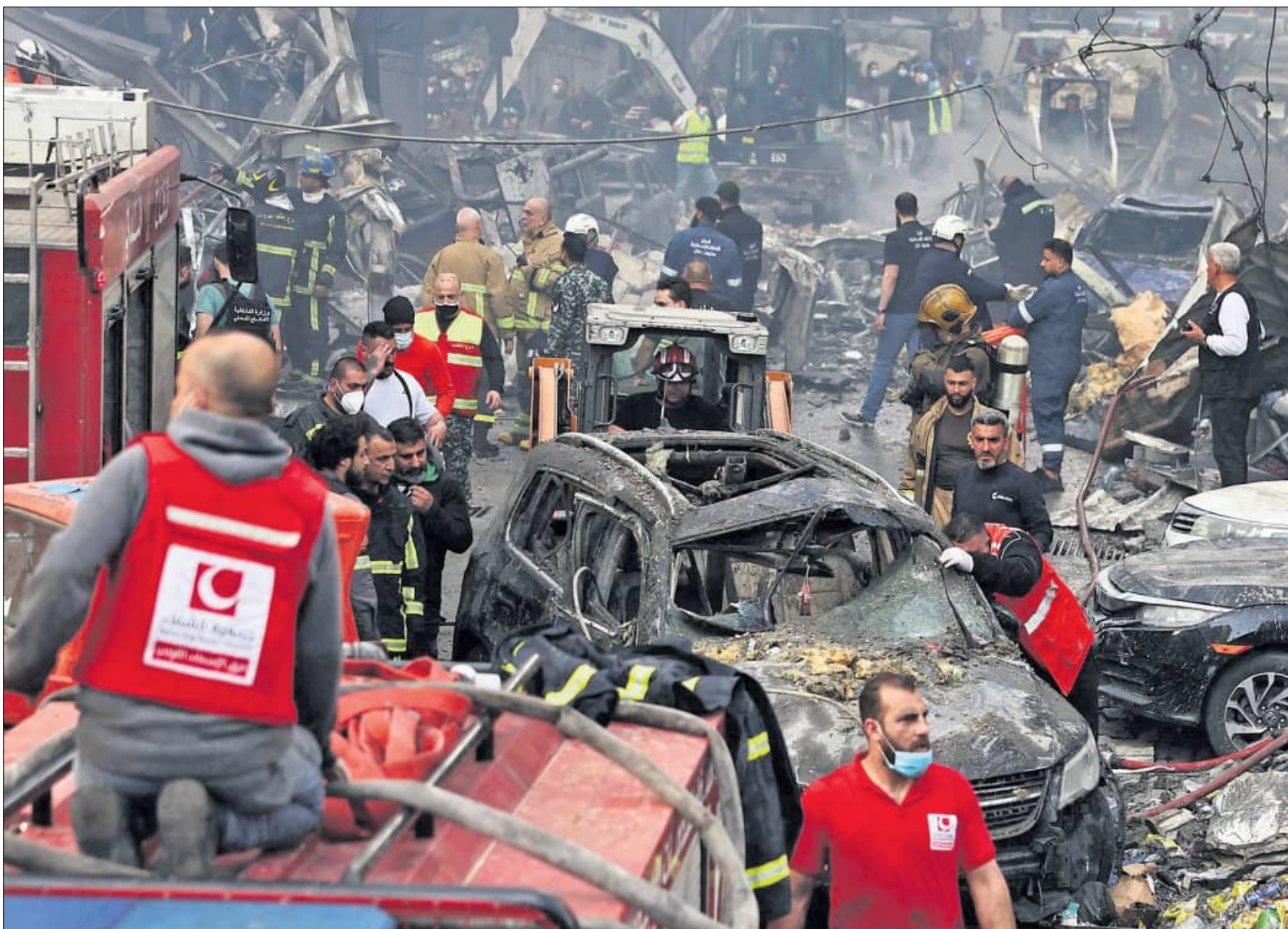
ଲେବାନନ୍‌ର ବିରୁଦ୍ଧ ଅଲମ୍ପିକ୍‌ରେ ଅଞ୍ଚଳ ବୁଧବାର ଲସ୍‌ଆସ୍‌ଲ୍ ଆକ୍ରମଣରେ ଧସିଯିଥିବା ହୋଇଯାଇଛି ।