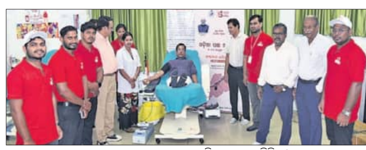
ରେଡ୍ କ୍ରସ୍ ଭବନଠାରେ ଆୟୋଜିତ ରକ୍ତଦାନ ଶିବିର।

ରକ୍ତଦାନ ଶିବିର ଏବଂ ସାଧାରଣ ସଭାର ଆୟୋଜନ କରାଯାଇଥିଲା।