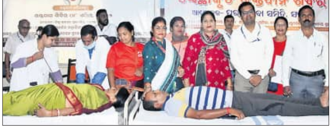
ଜଣେ ରକ୍ତଦାତା ରକ୍ତଦାନ କରୁଛନ୍ତି।