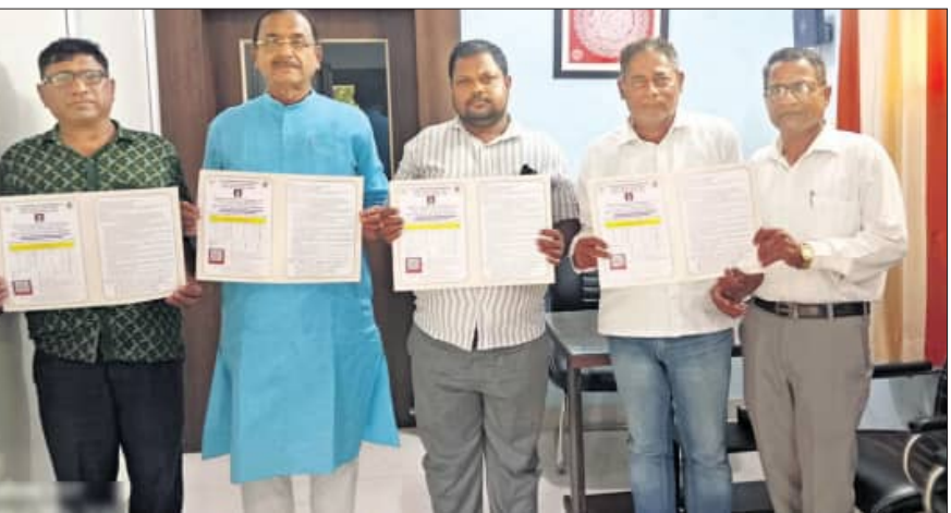
ପ୍ରତିଯୋଗିତାର କାର୍ଯ୍ୟସୂଚୀ ଉନ୍ମୋଚନ ଅବସରରେ ଉପସ୍ଥିତ ଅତିଥିବୃନ୍ଦ।