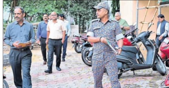
୬ ଜଣିଆ ଉଚ୍ଚସ୍ତରୀୟ କେନ୍ଦ୍ରୀୟ ଟିମ୍ ଏସ୍‌ସିବି ଟ୍ରା ଆଇସିସି ଅଗ୍ରଣୀ ଘଟଣାରେ ତଦନ୍ତ ପାଇଁ ଯାଇଛି।

କଟକ,୮୪(ଶିଳ୍ପା ପ୍ରିୟଦର୍ଶିନୀ) ଏସ୍‌ସିବି ଟ୍ରା ଆଇସିସି ଅଗ୍ରଣୀ ଘଟଣାରେ ତଦନ୍ତ ପାଇଁ ରୁଧିରୀ ମେଡିକାଲରେ ପହଞ୍ଚିଥିବା ୬ ଜଣିଆ ଉଚ୍ଚସ୍ତରୀୟ କେନ୍ଦ୍ରୀୟ ଟିମ୍ ମେଡିକାଲ କଲେଜ ଅଧ୍ୟକ୍ଷଙ୍କ କାର୍ଯ୍ୟାଳୟରେ ଟିମ୍ ପ୍ରାୟ ୨ଘଣ୍ଟା ଘଟଣା ସମୟରେ ଥିବା ଅଧିକାରୀଙ୍କୁ ପଚରାଉଚରା କରିବା ପରେ ଟିମ୍ କଲି ଯାଇଥିବା ଟ୍ରା ଆଇସିସିରେ ପ୍ରାୟ ଅଧଘଣ୍ଟା ଯାଞ୍ଚ କରିଥିଲା। ଯାଞ୍ଚ ପରେ ଟିମ୍ ଫେରି ଯାଇଥିବାବେଳେ କେନ୍ଦ୍ର ସରକାରଙ୍କୁ ରିପୋର୍ଟ ପ୍ରଦାନ କରିବ ବୋଲି ସୂଚନା ମିଳିଛି।