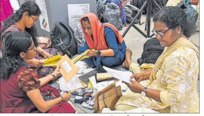
କେରଳ ବିଧାନସଭା ଭୋଟ ଅବ୍ୟବହାର ପୂର୍ବରୁ ଏକ କୁଳମ୍‌ରେ ପୋଲିଂ ଅଫିସରମାନେ ନିର୍ବାଚନ ସାମଗ୍ରୀ ଯାଞ୍ଚ କରୁଛନ୍ତି ।

ନେତୃତ୍ୱାଧୀନ ସଂଯୁକ୍ତ ଗଣତାନ୍ତ୍ରିକ ସାମ୍ବନ୍ଧ୍ୟ (ୟୁଡିଏଫ୍) ସ୍ଥିତିକୁ ଦୁର୍ବଳ କରିପାରେ ବୋଲି କୁହାଯାଉଛି । କାରଣ ୨୦୨୪ ଲୋକ ସଭା ନିର୍ବାଚନରେ ଭାଙ୍ଗିବା ଏହି ଦକ୍ଷିଣ ଭାରତୀୟ ରାଜ୍ୟରେ ଖାତା ଖୋଲି ଗୋଟିଏ ଆସନ ଦଖଲ କରିବାରେ