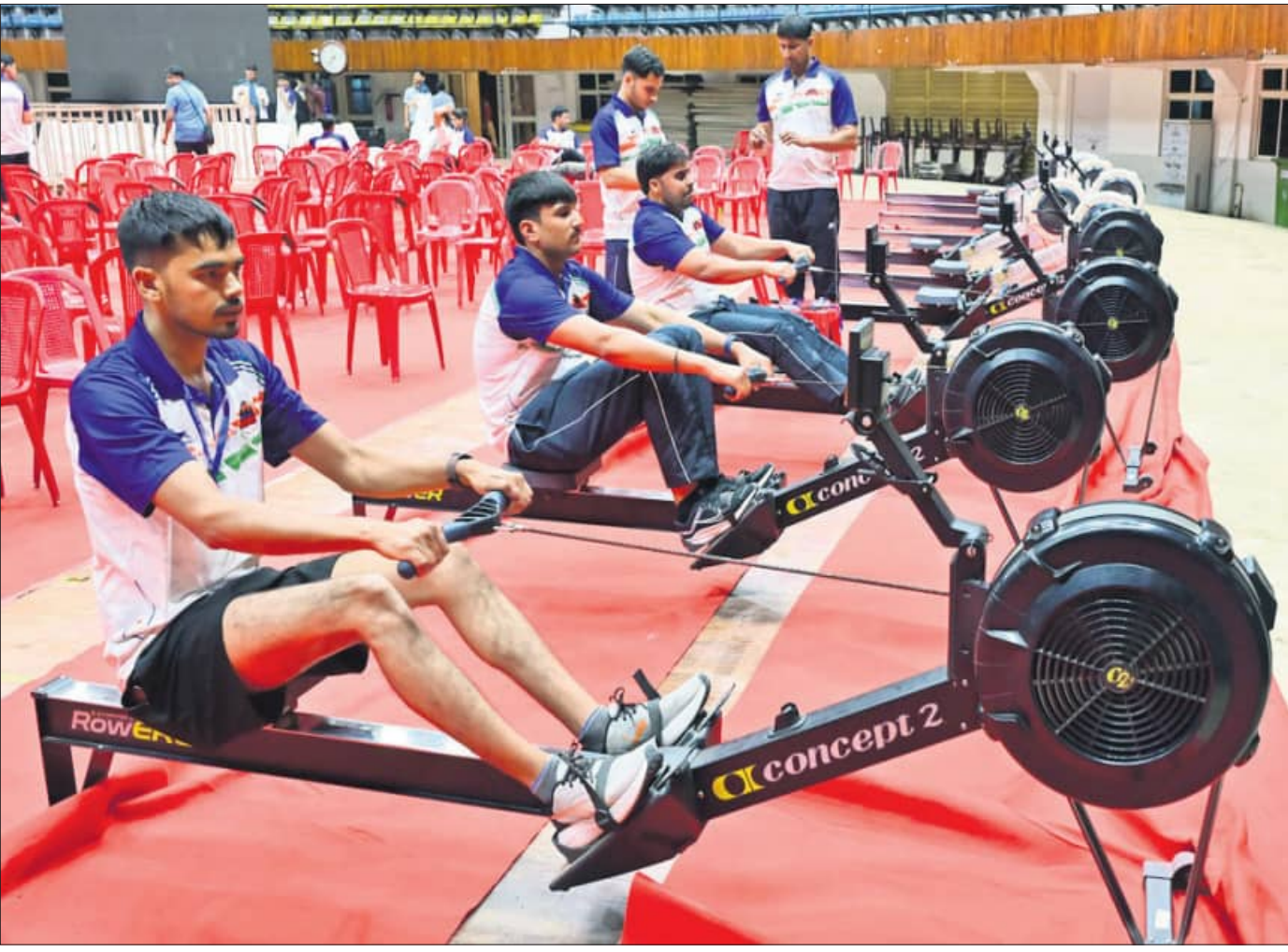
କଟକର ଜବାହରଲାଲ ନେହେରୁ ଇନ୍‌ଡୋର ସ୍ପୋର୍ଟସ୍ ମେଡ଼ିସିନ ଆରମ୍ଭ ହେବାକୁ ଯାଉଥିବା ଭିନ୍ନ ଧରଣର ସର୍ବଭାରତୀୟ ଯୋଗ୍ୟ ଚାମ୍ପିୟନସ୍‌ସିପ୍ ପୂର୍ବରୁ ପ୍ରତିଯୋଗୀଙ୍କ ଅଭ୍ୟାସ ।