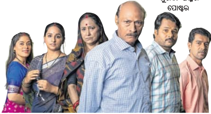
‘ପୁରବୀ’ ଫିଲ୍ମର ପୋଷ୍ଟର