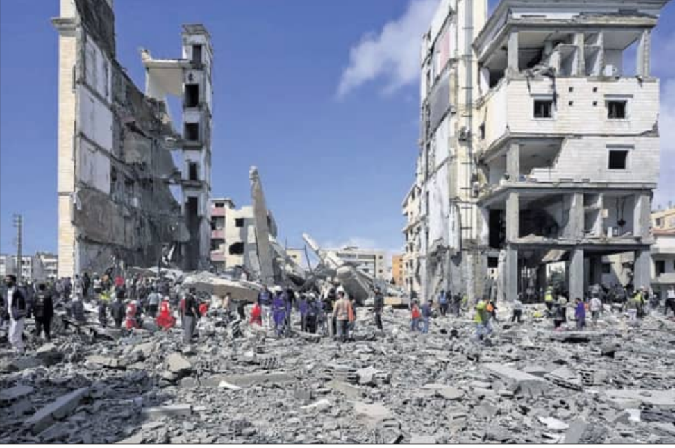
ଇରାନର ସାଇବାରେ ଇସ୍ରାଏଲ୍ ପକ୍ଷରୁ ବୁଧବାର ଏହାର ସ୍ତୂଳକ ପରେ ଉଗ୍ରାବଶେଷକୁ ଉଦ୍ଧାର କାର୍ଯ୍ୟ ଜାରି ରହିଛି ।

ପାକିସ୍ତାନ ମଧ୍ୟସ୍ତରରେ ଆମେରିକା ଓ ଇରାନ ମଧ୍ୟରେ ୨ ସପ୍ତାହର ଅସ୍ତ୍ରବିରତି ପାଇଁ ସହମତି ହୋଇଛି । ଆମେରିକା ରାଷ୍ଟ୍ରପତି ତୋନାଲ୍ଡ ଟ୍ରଷ୍ଟ ଇରାନକୁ 'ଷ୍ଟେଟ୍ ଅଫ୍ ହର୍ମ୍‌ଫୁଲ୍' ଖୋଲିବା ପାଇଁ ଶେଷ ସମୟ ସାମାନ୍ୟ ଦେଇଥିଲେ । ଏହି ସମୟ ସାମାନ୍ୟ ଶେଷ ହେବାର ୨ ଘଣ୍ଟା ପୂର୍ବରୁ ଏହି ଚୁକ୍ତି ହୋଇଛି । କିନ୍ତୁ ଏହି ଚୁକ୍ତିକୁ ନେଇ ଅନିଶ୍ଚିତତା ଦେଖାଦେଇଛି । ମୁଖ୍ୟ ବିବାଦଗୁଡ଼ିକର ସମାଧାନ ଏପର୍ଯ୍ୟନ୍ତ ହୋଇନାହିଁ । ଇରାନ ଏବଂ ଆମେରିକା ପରସ୍ପରର ସର୍ତ୍ତକୁ ନେଇ ଅଟକ ଅଛନ୍ତି । ଅସ୍ତ୍ରବିରତି ଘୋଷଣାର ମାତ୍ର କିଛି ଘଣ୍ଟା ପରେ ସଂଯୁକ୍ତ ଆରବ ଏମିରେଟ୍ସ (ସୁଏଜ) ଉପରେ ଇରାନ ପକ୍ଷରୁ ମିସାଇଲ ମାଡ଼ ହୋଇଥିବା ଖବର ମିଳିଛି । ସେହିପରି କୁଏଟ୍ ମଧ୍ୟ ଟ୍ରୋଫି ଆକ୍ରମଣର ଜବାବ ଦେଉଥିବା କୁହାଯାଇଛି । ଇରାନ ଦାବି କରିଛି ଯେ, ଏହି ଚୁକ୍ତି ଅନୁସାରେ ସେ ଜଳପଥ 'ଷ୍ଟେଟ୍ ଅଫ୍ ହର୍ମ୍‌ଫୁଲ୍' ଦେଇ ଯାଉଥିବା କାହାଜଗୁଡ଼ିକ ଉପରେ ଶୁଳ୍କ ଲଗାଇବ । ଇରାନର ସରକାରୀ ଗଣମାଧ୍ୟମ ଏହାକୁ ନିଜର ବିକୟ ବୋଲି କହୁଛି । ସେମାନଙ୍କ କହିବା ଅନୁସାରେ, ଆମେରିକା ସମସ୍ତ କଟକଣା ହଟାଇବାକୁ ରାଜି ହୋଇଛି । ଅନ୍ୟପକ୍ଷରେ ଲେବାନନ ଉପରେ ଆକ୍ରମଣ ବନ୍ଦ କରିବା ନାହିଁ ବୋଲି ଇସ୍ରାଏଲ୍ ସିଧାସଳଖ ମନା କରିଦେଇଛି । ଚେହେରାନର ରାଜପଥରେ ଇରାନ ଶାସକ ସମର୍ଥକମାନେ ଆମେରିକା ଏବଂ ଇସ୍ରାଏଲ୍ ବିରୋଧରେ ନାରାବାଦି କରୁଛନ୍ତି । ସେଠାରେ ଲୋକମାନେ ଏହି ଚୁକ୍ତିକୁ ନେଇ ଅସନ୍ତୋଷ ପ୍ରକାଶ କରୁଛନ୍ତି, ଯାହା ଶାନ୍ତି ପ୍ରକ୍ରିୟା ପାଇଁ ଏକ ବଡ଼ ବ୍ୟାଧି ହୋଇଛି । କାଗଜପତ୍ରରେ ମୁଦ୍ରିତ ବନ୍ଦ ହେବାର ଘୋଷଣା ହୋଇଥିଲେ ମଧ୍ୟ ଏହାର ସ୍ଥାୟିତ୍ୱ ନେଇ ପ୍ରଶ୍ନବାଚୀ ସୃଷ୍ଟି ହୋଇଛି ।