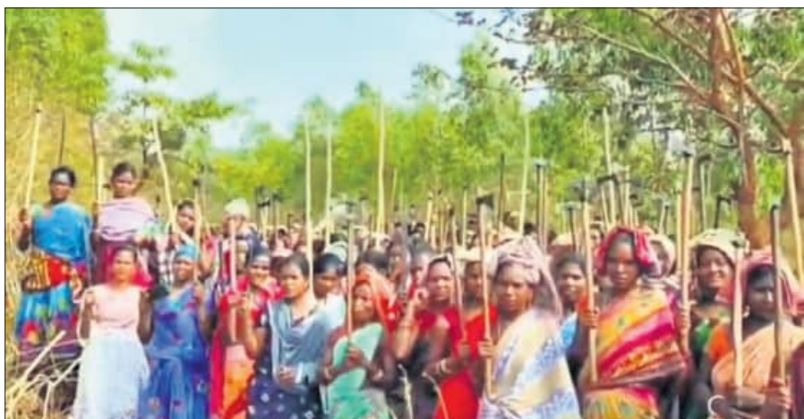
ରାୟଗଡ଼ା ଜିଲ୍ଲା କାଶୀପୁର ବ୍ଲକ୍ ସିଜିମାଳି ପାହାଡ଼ର ସୁରକ୍ଷା ପାଇଁ ରୁଧିର ଆଦିବାସୀ ମହିଳାମାନେ ପାରମ୍ପରିକ ଅସ୍ତ୍ରଶସ୍ତ୍ର ସହିତ ଏକାଠି ହୋଇଛନ୍ତି ।

ଦେବାଡ଼ ପାଇଁ ଲୋକଙ୍କୁ ଦମନ ଘଟଣା ମରିଚୁ ପଛେ ଦେବାଡ଼କୁ ସିଜିମାଳି ପାହାଡ଼ ଦେଖୁନାହିଁ : ଗ୍ରାମବାସୀ