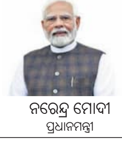
ନରେନ୍ଦ୍ର ମୋଦୀ ପ୍ରଧାନମନ୍ତ୍ରୀ