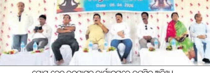
ଯୋଗ କେନ୍ଦ୍ର ଉଦ୍ଘାଟନ କାର୍ଯ୍ୟକ୍ରମରେ ଉପସ୍ଥିତ ଅତିଥି ।