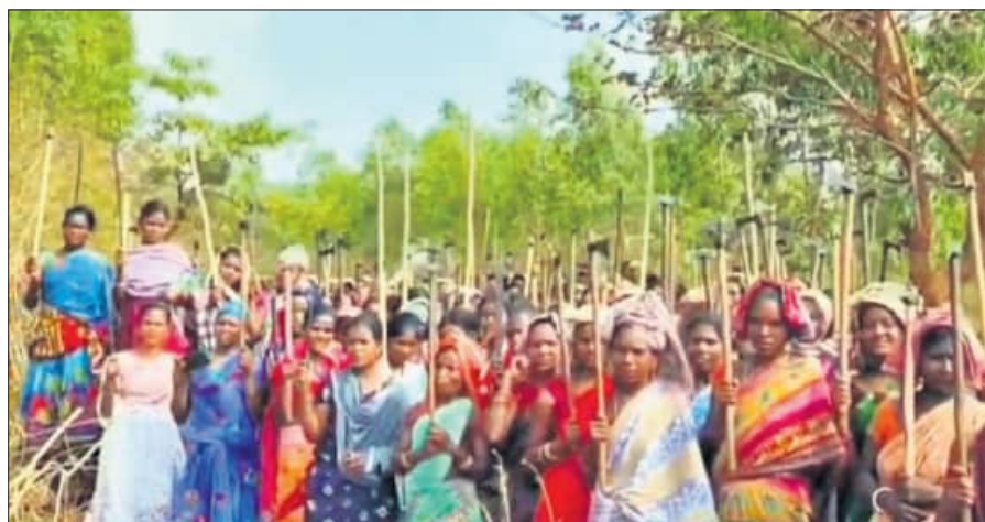
ରାୟଗଡ଼ା ଜିଲ୍ଲା କାଶୀପୁର ବ୍ଲକ୍ ସିଜିମାଳି ପାହାଡ଼ର ସୁରକ୍ଷା ପାଇଁ ରୁଧିବାର ଆଦିବାସୀ ମହିଳାମାନେ ପାରମ୍ପରିକ ଅସ୍ତ୍ରଶସ୍ତ୍ର ସହିତ ଏକାଠି ହୋଇଛନ୍ତି ।

ମରିଚୁ ପଛେ ଦେବାଡ଼କୁ ସିଜିମାଳି ପାହାଡ଼ ଦେଖୁନାହିଁ : ଗ୍ରାମବାସୀ