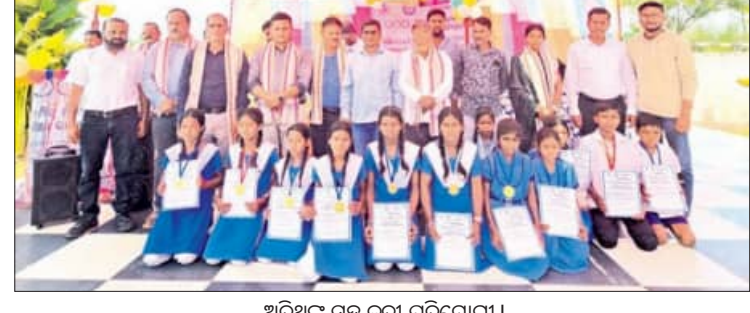
ଅତିଥି ସହ କୃତା ପ୍ରତିଯୋଗୀ ।