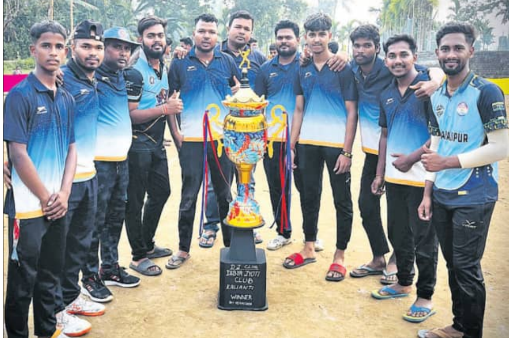
ଟ୍ରଫି ସହ ଚାମ୍ପିୟନ ପଲାଇ ଦଳର ଖେଳାଳିମାନେ ।