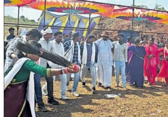
ଚଢ଼ତ ପରବରେ ଘାମାୟ ବାସିନ୍ଦା ନୃତ୍ୟ ପରିବେଷଣ କରୁଛନ୍ତି।

ସୁନାବେଟା/ସେମିଲିଗୁଡ଼ା, ୮୪ (କୃଷିବାସ ପ୍ରଧାନ/ବାସୁଦେବ ବରାଡ଼)