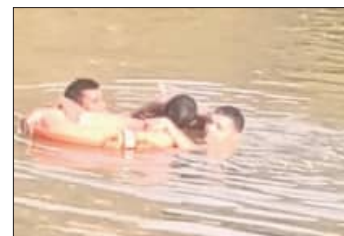
ନଦୀରେ ବୁଡ଼ି ନିଖୋଜ ହୋଇଯାଇଥିଲେ ।

ରାଜଗଡ଼ା ଜିଲ୍ଲା କଲ୍ୟାଣସିଂହପୁର ଅଞ୍ଚଳ ଦେଇ ପ୍ରବାହିତ ନାଗାବଳୀ ନଦୀରେ ବୁଡ଼ି ଜଣେ ମୁରକଙ୍କ ମୃତ୍ୟୁ ଘଟିଛି । ମୃତକ ହେଲେ କରପା ପଞ୍ଚାୟତ ପେଟିଲିଗୁଡ଼ା ଶ୍ରୀରାମ ନଗରର ସଦା ଝିଅ (୩୬) ।