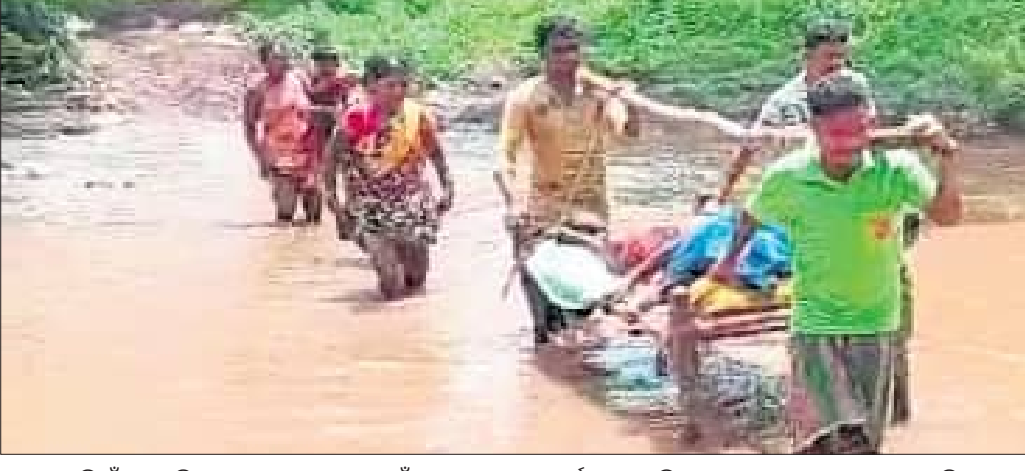
ଝରିଗାଁ ବ୍ଲକ ତାହାମାଳ ଗ୍ରାମର ବୁଢ଼ାମୁହାଣ ଗାଁକୁ ରାସ୍ତା ନ ଥିବାରୁ ଗର୍ଭବତୀଙ୍କୁ ଖଟିଆରେ ବୁହାଇ ନଦୀ ପାର କରାଯାଇଛି।

୧୪ ଓ ଉତ୍ତରକୋଟ ବ୍ଲକରେ ୨ଟି ଗାଁକୁ ଆମ୍ବୁଲାନ୍ସ ଆସିବା ପାଇଁ ଯାଇପାରେ ନାହିଁ । ଅନ୍ୟପକ୍ଷେ ମାତୃ ମୃତ୍ୟୁ ଓ ଶିଶୁ ମୃତ୍ୟୁହାର ରୋକିବା ପାଇଁ ଡାକ୍ତରଖାନାରେ ପ୍ରସବ ପାଇଁ କୁହାଯାଉଛି । ଦୁର୍ଗମ, ଅଗମ୍ୟ ଅଞ୍ଚଳରେ ଆମ୍ବୁଲାନ୍ସ ପହଞ୍ଚିବାକୁ ନ ଥିବାରୁ ଗର୍ଭବତୀମାନଙ୍କୁ ପ୍ରସବ ସମୟରୁ ଗୁରୁତ୍ୱପୂର୍ଣ୍ଣ ଭାବରେ ଯତ୍ନ ଦେବାକୁ ପଡ଼ିଛି ।