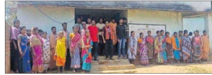
ଅଜ୍ଞାନତା କେନ୍ଦ୍ରରେ ତାଲା ପକାଇ ଗ୍ରାମବାସୀ ତଥା ହୋଇଛନ୍ତି।

ପାପଡ଼ାହାଣ୍ଡି, ୮୪ (ସ୍ୱପ୍ନାକ୍ଷର ପତ୍ରପାଠକ) ନବରଙ୍ଗପୁର ଜିଲାର ପାପଡ଼ାହାଣ୍ଡି ବ୍ଲକ ନୂଆକୋଟ ପଞ୍ଚାୟତ ନୂଆଗୁଡ଼ା ଗ୍ରାମର ଅଜ୍ଞାନତା କେନ୍ଦ୍ରରୁ ଆସୁଥିବା ଶ୍ରମିକମାନଙ୍କୁ ଶୁଣାଇବା ପାଇଁ ଗ୍ରାମବାସୀ ଗୁପ୍ତାବତୀ କେନ୍ଦ୍ରରେ ତାଲା ପକାଇ ଦେଇଥିଲେ। ଅଜ୍ଞାନତା କେନ୍ଦ୍ରରୁ ଆସୁଥିବା ଶ୍ରମିକମାନଙ୍କୁ ଶୁଣାଇବା ପାଇଁ ଗ୍ରାମବାସୀ ଗୁପ୍ତାବତୀ କେନ୍ଦ୍ରରେ ତାଲା ପକାଇ ଦେଇଥିଲେ। ଅଜ୍ଞାନତା କେନ୍ଦ୍ରରୁ ଆସୁଥିବା ଶ୍ରମିକମାନଙ୍କୁ ଶୁଣାଇବା ପାଇଁ ଗ୍ରାମବାସୀ ଗୁପ୍ତାବତୀ କେନ୍ଦ୍ରରେ ତାଲା ପକାଇ ଦେଇଥିଲେ। ଅଜ୍ଞାନତା କେନ୍ଦ୍ରରୁ ଆସୁଥିବା ଶ୍ରମିକମାନଙ୍କୁ ଶୁଣାଇବା ପାଇଁ ଗ୍ରାମବାସୀ ଗୁପ୍ତାବତୀ କେନ୍ଦ୍ରରେ ତାଲା ପକାଇ ଦେଇଥିଲେ।