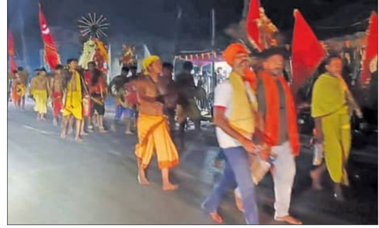
ଶୋଭାଯାତ୍ରାରେ ମା'ଙ୍କୁ ଗ୍ରାମ ପରିକ୍ରମା କରାଯାଇଛି ।

ନବରଙ୍ଗପୁର ଜିଲାର ପାପଡ଼ାହାଣ୍ଡିରେ କୁଧିବାର ମହାଆଡ଼ମ୍ବର ସହ ମା' ଦଣ୍ଡକାଳୀଙ୍କ ପୂଜା ଅନୁଷ୍ଠିତ ହୋଇଛି । ମା'ଙ୍କୁ ପୂଜାର୍ଚ୍ଚନା ସହ ଧୂଳିଦଣ୍ଡ, ଅଗ୍ନିଦଣ୍ଡ, ପାଣିଦଣ୍ଡ ଆୟୋଜନ ହୋଇଥିଲା । ଏହା ପୂର୍ବରୁ ବସ୍ତ୍ରାଣ୍ଡ ଛକକୁ ମା'ଙ୍କୁ ପାଞ୍ଚୋଟି ଅଣାଯାଇ ବାଦ୍ୟବାଜୀଶା ସହ ଗ୍ରାମ ପରିକ୍ରମା କରି ବସ୍ତ୍ରାଣ୍ଡ ବୃତ୍ତୀପୂଜା ମଣ୍ଡପ ନିକଟରେ ପହଞ୍ଚିଥିଲେ । ସେଠାରେ ନାଟକାନ୍ତ ଅନୁସାରେ ପୂଜାକଳା ହୋଇଥିଲା । ବାଲିନେଳାକୁ ଆସିଥିବା ଦଣ୍ଡୁଆ ବଳ ମଣ୍ଡପ ନିକଟରେ ଧୂଳିଦଣ୍ଡ ପ୍ରଦର୍ଶନ କରିଥିଲେ । ଗାଁର ଶେରବ ପୋଖରୀରେ ପାଣିଦଣ୍ଡ ହୋଇଥିଲା । ସନ୍ଧ୍ୟାରେ ଗାଁ ପରିକ୍ରମା ଅଗ୍ନିଦଣ୍ଡ ପ୍ରଦର୍ଶିତ ହୋଇଥିଲା । ରାତି ସମୟରେ ଖାଡ଼େଶ୍ୱର ମନ୍ଦିରଠାରେ ଆଳତି ହୋଇଥିଲା । ରାତି ତମାମ ସାଂସ୍କୃତିକ କାର୍ଯ୍ୟକ୍ରମ ଆୟୋଜନ