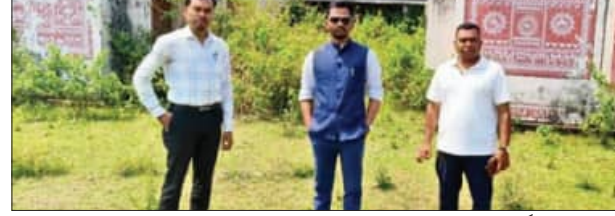
ଦେପୁଟି କଲେକ୍ଟର, ମଙ୍ଗଳ ସମ୍ପ୍ରଦାୟର ଅଧିକାରୀ ଓ ସ୍ଥାନୀୟ ସରପଞ୍ଚ ଘଟଣାସ୍ଥଳ ପରିଦର୍ଶନ କରୁଛନ୍ତି ।

ଖବର ପ୍ରକାଶ ପରେ କୋଠା ଯାଞ୍ଚକଲେ ଅଧିକାରୀ ଅବହେଳିତ ଅବସ୍ଥାରେ ଆବଡ଼ା ଏକ୍ସ୍ପ୍ରେକ୍ସନ୍ କମ୍ପ୍ଲେକ୍ସ କରାଯାଇଥିବା ସମ୍ବନ୍ଧରେ ଖବର ପ୍ରକାଶ ହେବା ପରେ କୋଠା ଯାଞ୍ଚକଲେ ଅଧିକାରୀ ଅବହେଳିତ ଅବସ୍ଥାରେ ଆବଡ଼ା ଏକ୍ସ୍ପ୍ରେକ୍ସନ୍ କମ୍ପ୍ଲେକ୍ସ ନିର୍ମାଣ ହୋଇଥିଲା ।