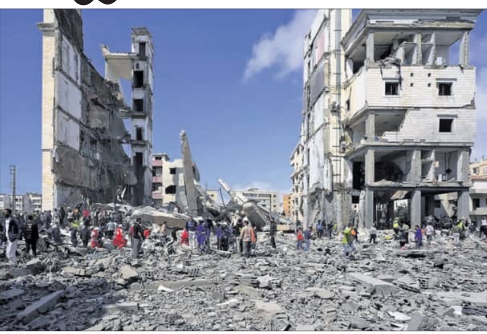
ଇରାନର ସାଇବାରେ ଇସ୍ତ୍ରାଏଲ୍ ପକ୍ଷରୁ ବୁଧବାର ଏହାର ସ୍ତ୍ରାୟକ ପରେ ଉଗ୍ରାବଶେଷକୁ ଉଦ୍ଧାର କାର୍ଯ୍ୟ ଜାରି ରହିଛି ।

ପାକିସ୍ତାନ ମଧ୍ୟସ୍ତରରେ ଆମେରିକା ଓ ଇରାନ ମଧ୍ୟରେ ୨ ସପ୍ତାହର ଅସ୍ତ୍ରବିରତି ପାଇଁ ସହମତି ହୋଇଛି । ଆମେରିକା ରାଷ୍ଟ୍ରପତି ତୋନାଲ୍ଡ ଟ୍ରମ୍ପ ଇରାନକୁ 'ଷ୍ଟେଟ୍ ଅଫ୍ ହର୍ମ୍ଫୁଲ୍' ଘୋଷଣା ପାଇଁ ଶେଷ ସମୟ ସାମାନ୍ୟ ଦେଇଥିଲେ । ଏହି ସମୟ ସାମାନ୍ୟ ଶେଷ ହେବାର ୨ ଘଣ୍ଟା ପୂର୍ବରୁ ଏହି ଚୁକ୍ତି ହୋଇଛି । କିନ୍ତୁ ଏହି ଚୁକ୍ତିକୁ ନେଇ ଅନିଶ୍ଚିତତା ଦେଖାଦେଇଛି । ମୁଖ୍ୟ ବିବାହଗୁଡ଼ିକର ସମାଧାନ ଏପର୍ଯ୍ୟନ୍ତ ହୋଇନାହିଁ । ଇରାନ ଏବଂ ଆମେରିକା ପରସ୍ପରର ସର୍ତ୍ତକୁ ନେଇ ଅଟକ ଅଛନ୍ତି । ଅସ୍ତ୍ରବିରତି ଘୋଷଣାର ମାତ୍ର କିଛି ଘଣ୍ଟା ପରେ ସଂଯୁକ୍ତ ଆରବ ଏମିରେଟ୍ସ (ୟୁଏଇ) ଉପରେ ଇରାନ ପକ୍ଷରୁ ମିସାଇଲ ମାଡ଼ ହୋଇଥିବା ଖବର ମିଳିଛି । ସେହିପରି କୁସର୍ ମଧ୍ୟ ଛୋଟ ଆକ୍ରମଣର ଜବାବ ଦେଉଥିବା ଜୁହାପାଇଛି । ଇରାନ ଦାବି କରିଛି ଯେ, ଏହି ଚୁକ୍ତି ଅନୁସାରେ ସେ ଜଳପଥ 'ଷ୍ଟେଟ୍ ଅଫ୍ ହର୍ମ୍ଫୁଲ୍' ଦେଇ ଯାଉଥିବା କାହାଜଗୁଡ଼ିକ ଉପରେ ଶୁଳ୍କ ଲଗାଇବ । ଇରାନର ସରକାରୀ ଗଣମାଧ୍ୟମ ଏହାକୁ ନିକଟ ବିକୟ ବୋଲି କହୁଛି । ସେମାନଙ୍କ କହିବା ଅନୁସାରେ, ଆମେରିକା ସମସ୍ତ କଟକଣା ହଟାଇବାକୁ ରାଜି ହୋଇଛି । ଅନ୍ୟପକ୍ଷରେ ଲେବାନନ ଉପରେ ଆକ୍ରମଣ ବନ୍ଦ କରିବା ନାହିଁ ବୋଲି ଇସ୍ତ୍ରାଏଲ୍ ସିଧାସଳଖ ମନା କରିଦେଇଛି । ଚେହେରାନର ରାଜପଥରେ ଇରାନ ଶାସକ ସମର୍ଥକମାନେ ଆମେରିକା ଏବଂ ଇସ୍ତ୍ରାଏଲ୍ ବିରୋଧରେ ନାରାବାଦି କରୁଛନ୍ତି । ସେଠାରେ ଲୋକମାନେ ଏହି ଚୁକ୍ତିକୁ ନେଇ ଅସନ୍ତୋଷ ପ୍ରକାଶ କରୁଛନ୍ତି, ଯାହା ଶାନ୍ତି ପ୍ରକ୍ରିୟା ପାଇଁ ଏକ ବଡ଼ ବ୍ୟାଧିକାର ହୋଇଛି । କାଗଜପତ୍ରରେ ଯୁଦ୍ଧ ବନ୍ଦ ହେବାର ଘୋଷଣା ହୋଇଥିଲେ ମଧ୍ୟ ଏହାର ସ୍ତାୟିତ୍ୱ ନେଇ ପ୍ରଶ୍ନବାଚୀ ସୃଷ୍ଟି ହୋଇଛି ।