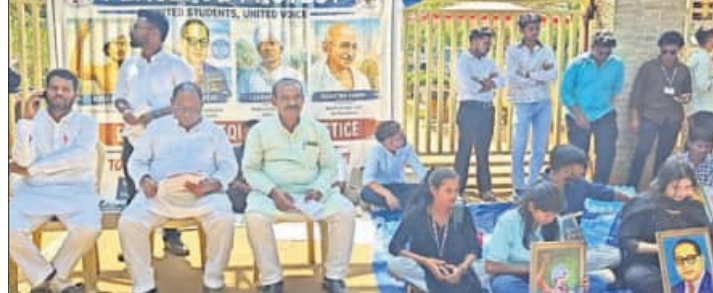
ବିଶ୍ୱବିଦ୍ୟାଳୟ ଛାତ୍ରାଛାତ୍ର ଓ କଂଗ୍ରେସ ପକ୍ଷରୁ ଶାନ୍ତିପୂର୍ଣ୍ଣ ପ୍ରତିବାଦ କରାଯାଇଛି।

ରେଜିଷ୍ଟ୍ରେଟ ମନମୁଖୀ କାର୍ଯ୍ୟକଳାପ ବନ୍ଦ କରିବାକୁ ସେମାନେ ଅତି ବସିଥିଲେ। ହଷ୍ଟେଲରେ ପାଣି ସମସ୍ୟା, ଖାଇବା, ଲାଲ୍‌ବେଟା, ଷ୍ଟାଇପେଣ୍ଡ, ଅଧ୍ୟାପକ