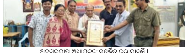
ଅବସରପ୍ରାପ୍ତ ଅଧ୍ୟାପକଙ୍କୁ ସମ୍ବର୍ଦ୍ଧନା କରାଯାଇଛି ।

ରଂଶଧାରା ଅବବାହିକା ଦୀର୍ଘଦିନର ଉତ୍ତରୀକୃତ ଶିକ୍ଷାଦାନ ଓ ଅନୁଷ୍ଠାନ ପ୍ରତି ତାଙ୍କ ଅବଦାନକୁ ସ୍ମରଣ କରିଥିଲେ । ସଭାରେ ଉପସ୍ଥିତ ବିଭାଗର ପୁରାତନ ଓ ବର୍ତ୍ତମାନ ଛାତ୍ରାଛାତ୍ରୀ ଉପସ୍ଥିତ ଥିଲେ ।