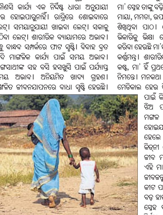
ମଣିଷ ପ୍ରତିଦିନ ସକାଳୁ ସନ୍ଧ୍ୟାଯାଏ ବୌଦ୍ଧି, କିନ୍ତୁ କିଛି କାମ ହେଇପାରୁନାହିଁ। କୁହାଯାଏ 'ବିକି ଫର ନଥ'। ଆଗକାଳ ମଣିଷ ବୁକୁଡ଼ା ଡାକିଲେ ଉଠି ଯାଉଥିଲେ। ନିତ୍ୟକର୍ମ ସାରି ଯେ ଯାହା କାମରେ ଯାଉଥିଲେ। ସନ୍ଧ୍ୟା ଛ'ଟା ବେଳେ ପୁଣି ଘରକୁ ଫେରି ଆସୁଥିଲେ। ପରିବାର ସହିତ ସମୟ ବିତାଉଥିଲେ। ପୁଅ ବୁଝି ହେଉଥିଲେ। ବଡ଼ ପରିବାର ଥିଲା। ସମସ୍ତେ ସମସ୍ତଙ୍କ ଠାକୁ କିଛି ଶିକ୍ଷାଲାଭ କରୁଥିଲେ। ଅବାଟ ଧରିଲେ ଏବଂ ସମୃଦ୍ଧିଶୀଳ କରିଛି। ପାଦେ ପାଦେ ସଚେତକ ଭାବରେ ଠିଆ ହୋଇ ଦିଗବର୍ତ୍ତକ ସାଜି ଖରାପ ରାସ୍ତାରେ ଚାଲିବାଠାକୁ ଦୂରେଇ ରଖୁଛି। ବାସ୍ତବରେ ବର୍ତ୍ତମାନର ବ୍ୟସ୍ତତା ଭିତରେ

ଅବଶ୍ୟ ଦୁଇଟି ଫୋନ୍ କଲରେ ଦୁଇଟି ଲାଭ୍ୟ ରହିଛି। ଗୋଟିଏ ସ୍ୱାସ୍ଥ୍ୟ ସମ୍ବନ୍ଧୀୟ, ଅନ୍ୟଟି ସମ୍ପଦ ସମ୍ବନ୍ଧୀୟ। ଗୋଟିଏ ଜନନୀର ସ୍ନେହ ଏବଂ ଅନ୍ୟଟି ଜାୟର ମୋହ। ଗୋଟିଏ ବାସ୍ତବ୍ୟମମତା, ଅନ୍ୟଟି ମାୟାର ବନ୍ଧନ। ଆମେ ମାନିବାକୁ ବାଧ୍ୟ ଯେ, ଦୁଇଟି ଫୋନ୍ କଲ ହିଁ ଏ ପୁରୁଷସମାଜକୁ ସ୍ୱାସ୍ଥ୍ୟବାନ୍ ଏବଂ ସମୃଦ୍ଧିଶୀଳ କରିଛି। ପାଦେ ପାଦେ ସଚେତକ ଭାବରେ ଠିଆ ହୋଇ ଦିଗବର୍ତ୍ତକ ସାଜି ଖରାପ ରାସ୍ତାରେ ଚାଲିବାଠାକୁ ଦୂରେଇ ରଖୁଛି। ବାସ୍ତବରେ ବର୍ତ୍ତମାନର ବ୍ୟସ୍ତତା ଭିତରେ