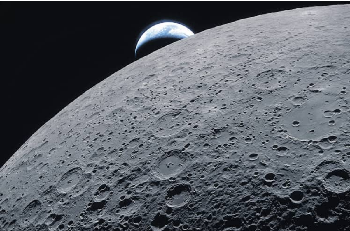
ଆର୍ଟେମିସ୍-୨ ମିଶନର ମହାକାଶଚାରୀମାନେ ଚନ୍ଦ୍ର ପରିକ୍ରମା କରୁଥିବା ସମୟରେ ଚନ୍ଦ୍ର ପଛରେ ପୃଥିବୀ ଅପ୍ସ ହେବା ଦୃଶ୍ୟକୁ ଉଦ୍ଧାରଣ କରୁଛନ୍ତି । ଆମେରିକାର ମହାକାଶ ଗବେଷଣା ସଂସ୍ଥା 'ନାସା' ଦ୍ୱାରା ଏହି ଚିତ୍ର ଜାରି କରାଯାଇଛି ।