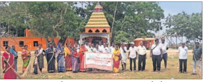
ସ୍ୱଚ୍ଛତା କାର୍ଯ୍ୟକ୍ରମରେ ସାମିଲ ହୋଇଥିବା ବିଭିନ୍ନ କର୍ମକର୍ତ୍ତା।

ରଘୁଲୁପୁର ରୁକ୍ ଅଧୀନ ଭୋରକା ପଞ୍ଚାୟତରେ ୧୯ଏପ୍ରିଲରୁ ୨୪ଏପ୍ରିଲ ପର୍ଯ୍ୟନ୍ତ ଓଡ଼ିଆ ପକ୍ଷ ପାଳନ କରାଯାଇଛି। ଏହି ଅବସରରେ ଗ୍ରାମୀଣ ସ୍ତରରୁ ସ୍ୱଚ୍ଛତା ଅଭିଯାନ ଆରମ୍ଭ କରାଯାଇଛି। ଗ୍ରାମୀଣ ସ୍ତରରୁ ସ୍ୱଚ୍ଛତା ଅଭିଯାନ ଆରମ୍ଭ କରାଯାଇଛି। ଗ୍ରାମୀଣ ସ୍ତରରୁ ସ୍ୱଚ୍ଛତା ଅଭିଯାନ ଆରମ୍ଭ କରାଯାଇଛି।