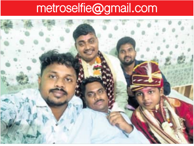
ରାଜପୁର, ୮୪ (ହର୍ଷବର୍ଦ୍ଧନ ବେହେରା)