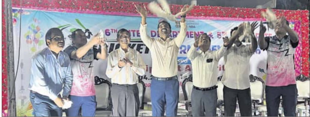
ଆନ୍ଧ୍ର ବିଭାଗୀୟ କ୍ରିକେଟ ଚୁନାମେଣ୍ଟ ଉଦ୍‌ଘାଟନା ଉତ୍ସବରେ ଯୋଗଦେଇଥିବା ଅତିଥି ।