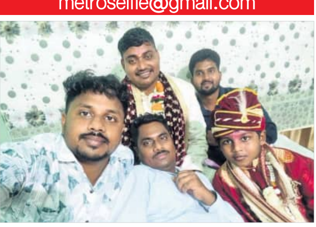
କରତ୍ୟକ୍ତପୁର, ୮୪ (ପ୍ରମୋଦ କୁମାର ନାୟକ)