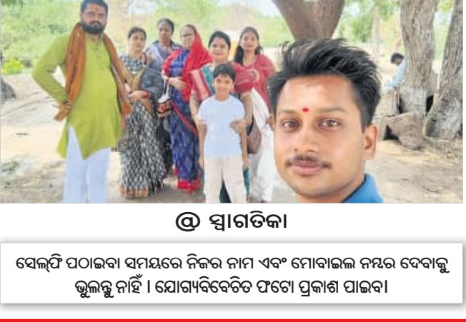
ସେଲ୍ଫି ପଠାଇବା ସମୟରେ ନିଜର ନାମ ଏବଂ ମୋବାଇଲ ନମ୍ବର ଦେବାକୁ କୁଳକୁ ନାହିଁ। ଯୋଗ୍ୟବେତନ ପତ୍ନୀ ପ୍ରକାଶ ପାଇବ।

ହର୍ମୁଳ ସ୍ତେର୍ ଦେଇ ବିଶ୍ୱର ପାଖାପାଖି ୨୦ ପ୍ରତିଶତ ଅଣୋଧିକ ତେଲ ଓ ଗାଧା ଦିଲିଲ ଦେଖିବାକୁ ସମ୍ଭବ ପଥରେ ପରିବହନ ହେଉଛି। ଭରଣ ଅଳ୍ପ ଲଗାଇ ଦେବାକୁ ଅଧିକା ହୋଇଥିଲା। ଯଦିଓ ଭାରତରେ ସେଇଲି ସମସ୍ୟା ହୋଇନି ତଥାପି ଅନେକ ଅଧାଧୁ ବ୍ୟବସାୟୀ, ଦଳାଳ, କର୍ମଚାରୀ ପେଟ୍ରୋଲ ଓ ଡିଜେଲର ଅଭାବ ଥିବା ମିଥ୍ୟା ପ୍ରଚାର କରି କଳାବଜାରକୁ ପ୍ରୋତ୍ସାହିତ କରିଥିଲେ। ଯେଉଁ କାରଣରୁ ପେଟ୍ରୋଲ ପମ୍ପଗୁଡ଼ିକରେ ଅପମିଶ୍ରଣ ହାର ବଢ଼ିଯାଇଛି। ଏ ସମ୍ପର୍କରେ ଛୁଇଁକାବାମାନେ କହିଛନ୍ତି, ଅପମିଶ୍ରଣର ମୁଖ୍ୟ କାରଣ ହେଉଛି ନାମିଆ ଓ ଅଧିକାଂଶ କଳାବଜାର ଦଳାଳଗଣ। କିଲୋରେ ଏହାର ଚୋରା ଚାଲାଣ ରାୟାକେନ୍ଦ୍ର ସକ୍ରିୟ ଥିଲେ ସୁଦ୍ଧା କାର୍ଯ୍ୟାନୁଷ୍ଠାନ ହେଉନା। ଯେଉଁଥିପାଇଁ ରାୟାକେନ୍ଦ୍ର ପେଟ୍ରୋଲ ପମ୍ପ ମାଲିକ ଓ ଅଧାଧୁ ତେଲ କମ୍ପାନୀ କର୍ମଚାରୀଙ୍କ ସମ୍ପର୍କରେ ରହି ଅପମିଶ୍ରଣକୁ ପ୍ରୋତ୍ସାହିତ କରାଯାଇଛି। ଗାୟୋଲିନ୍ ଏବଂ ଡିଜେଲର ନିକଟବର୍ତ୍ତୀ କେତେକ ତେଲ ପଦାର୍ଥ ଆଦି ରହିଛି