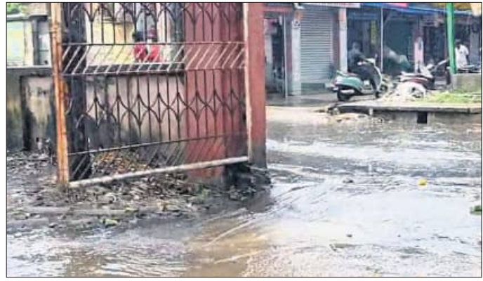
ଚହରିଲ ସମ୍ପୃକ୍ତ ରାସ୍ତାରେ ପାଣି ।

ଆଜି କୁଜଙ୍ଗ ମହୋତ୍ସବ ■ ବଜାରରେ ଆବର୍ଜନା ଭର୍ତ୍ତି ■ ଷ୍ଟ୍ରିଟ୍ ଲାଇଟ୍ ଜଳୁନି, ଅଧିକାଂଶରେ ରାସ୍ତାଘାଟ କୁଜଙ୍ଗ, ଠାଟ(ମନୋଜ ପ୍ରଧାନ)