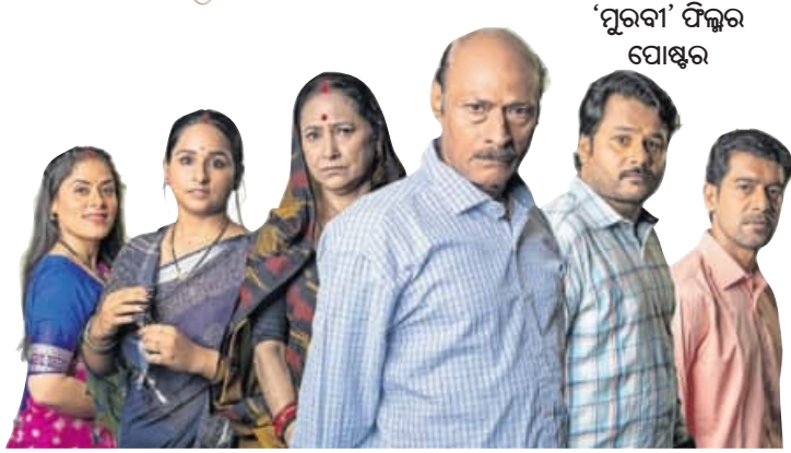
‘ପୁରବା’ ଫିଲ୍ମର ପୋଷ୍ଟର