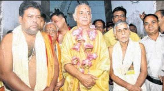
ଗଜପତି ମହାରାଜା ଦିବ୍ୟସିଂହ ଦେବ ରତ୍ନଭଣ୍ଡାରର ଗଣତିମଣତି ତଦାରଖ କରି ଫୋଟୁଛନ୍ତି ।