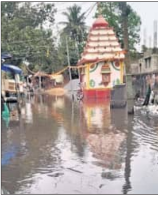
ମନ୍ଦିର ବେଢ଼ାରେ ବର୍ଷା ପାଣି ।

କୁଜଙ୍ଗର ଐତିହ୍ୟ, ସଂସ୍କୃତି, ପରମ୍ପରା ରୋମାଞ୍ଚନ ନିମନ୍ତେ ଗୁରୁବାର କୁଜଙ୍ଗ ମହୋତ୍ସବ ଉଦ୍‌ଘାଟନ ହେବ । ଏଥିନିମନ୍ତେ ମହୋତ୍ସବ କମିଟି ପକ୍ଷରୁ ଜନସମାଗମ ନିମନ୍ତେ ଦୀର୍ଘ ଏକ ସପ୍ତାହ ହେବ ଗାଁ ଗାଁରେ ପ୍ରଚାର ଗାଡ଼ି ଚଳାଯାଇଛି । ଖାଲି ସେତିକି ନୁହେଁ, ୫ ଦିନ ଧରି ଅନୁଷ୍ଠିତ ହେବାକୁଥିବା ଏହି ମହୋତ୍ସବର ବିଭିନ୍ନ ସନ୍ଧ୍ୟାରେ ନେତା, ମନ୍ତ୍ରୀ ଓ ବନ୍ଧୁ ନାମାଦୀମାନଙ୍କୁ ନିମନ୍ତ୍ରଣ କରାଯାଉଛି ।