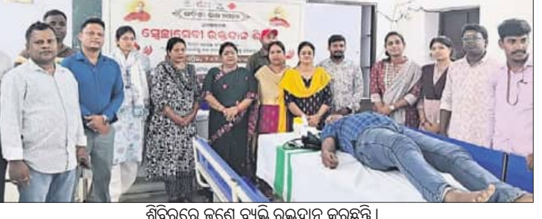
ଶିବିରରେ ଜଣେ ବ୍ୟକ୍ତି ରକ୍ତଦାନ କରୁଛନ୍ତି ।

ଓଡ଼ିଆ ପକ୍ଷ ପାଳନ କରତ୍ସିଂହପୁର, ଠାଟ (ପ୍ରମୋଦ କୁମାର ନାୟକ)