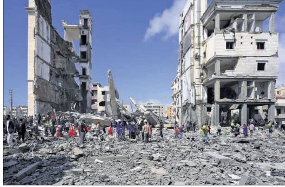
କରାନ୍ତୁର ସାଲ୍ତାରେ ଇସ୍ତାଫା ପସରୁ ରୁଧିର ଏହାର ସ୍ତମ୍ଭ ପରେ ଉତ୍ତରାଖଣ୍ଡର ଉଦ୍ଧାର କାର୍ଯ୍ୟ ଜାରି ରହିଛି ।

■ ଯୁଦ୍ଧ, କୁସୂଚ, ବାହାରିନରେ ଆକ୍ରମଣ ଜାରି ■ ହେଉଁଦେଲ୍ଲୀକୁ ଇସ୍ତାଫା ଟାଣିବେ