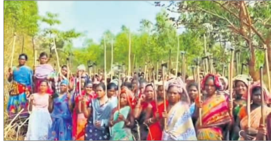
ରାୟଗଡ଼ା ଜିଲ୍ଲା କାଶୀପୁର ବ୍ଲକ୍ ସିଜିମାଳି ପାହାଡ଼ର ସୁରକ୍ଷା ପାଇଁ ରୁଧିବାର ଆଦିବାସୀ ମହିଳାମାନେ ପାରମ୍ପରିକ ଅସ୍ତ୍ରଶସ୍ତ୍ର ସହିତ ଏକାଠି ହୋଇଛନ୍ତି ।

ଦେବାଡ଼ ପାଇଁ ଲୋକଙ୍କୁ ଦମନ ଘଟଣା ମରିଚୁ ପଛେ ଦେବାଡ଼କୁ ସିଜିମାଳି ପାହାଡ଼ ଦେଖୁନାହିଁ : ଗ୍ରାମବାସୀ