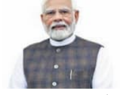
ନରେନ୍ଦ୍ର ମୋଦୀ ପ୍ରଧାନମନ୍ତ୍ରୀ

ଆଉ କିଛିଦିନ ପରେ, ସମଗ୍ର ଭାରତବର୍ଷ ଉତ୍ସବପୂର୍ଣ୍ଣ ହୋଇଉଠିବ ଏବଂ ଦେଶର କୋଣ ଅନୁକୋଣରେ ହର୍ଷୋଲ୍ଲାସର ସହ ପାର୍ବଣର ପରିବେଶ ଦେଖିବାକୁ ମିଳିବ। ଆସାମର ଲୋକମାନେ ରଙ୍ଗାଳି ବିନ୍ଦୁ ପାଳନ କରିବାକୁ ଯାଉଥିବା ବେଳେ ଓଡ଼ିଶାବାସୀ ମହାବିଷୁବ ପଣା ସଂକ୍ରାନ୍ତି ପାଳିବେ। ପଶ୍ଚିମବଙ୍ଗରେ ପୋଇଲା ବୈଶାଖ ପାଳନ ସହିତ ବଙ୍ଗାୟ ନବବର୍ଷର ଶୁଭାରମ୍ଭ ହେବ। କେରଳରେ ପ୍ରବଳ ଉତ୍ସାହ ଓ ଉଦ୍‌ଘୋଷ ସହିତ ବିନ୍ଦୁ ପାଳନ କରାଯିବ। ସେହିପରି ତାମିଲନାଡୁରେ ପୁଆଷୁ ପାଳନ ହେବାକୁ ଥିବା ବେଳେ ପଞ୍ଜାବ ଓ ଉତ୍ତର ଭାରତର ଅନ୍ୟ ପ୍ରାନ୍ତରେ ବୈଶାଖୀ ପାଳନ କରାଯିବ। ଏସବୁ ପର୍ବପର୍ବାଣି ସକାମାଗୁକତା ସହିତ ଆଶାର ଏକ ଭାବନା ସୃଷ୍ଟି କରିବା ଭାରତ ଓ ବିଦେଶରେ ଏସବୁ ପର୍ବପର୍ବାଣି ପାଳନ କରୁଥିବା ସମସ୍ତଙ୍କୁ ମୋର ଶୁଭକାମନା। ଏସବୁ ପବିତ୍ର ପର୍ବପର୍ବାଣି ସମସ୍ତଙ୍କ ଜୀବନରେ ସୁଖ ଓ ସମୃଦ୍ଧି ନେଇ ଆସୁ।