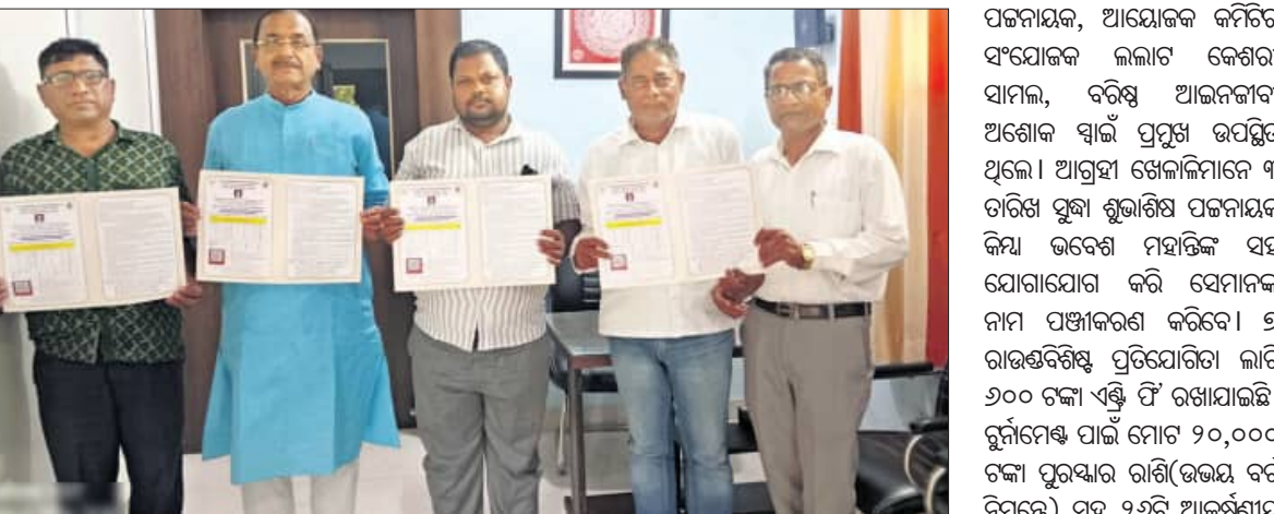
ପ୍ରତିଯୋଗିତାର କାର୍ଯ୍ୟସୂଚୀ ଉନ୍ମୋଚନ ଅବସରରେ ଉପସ୍ଥିତ ଅତିଥିବୃନ୍ଦ ।