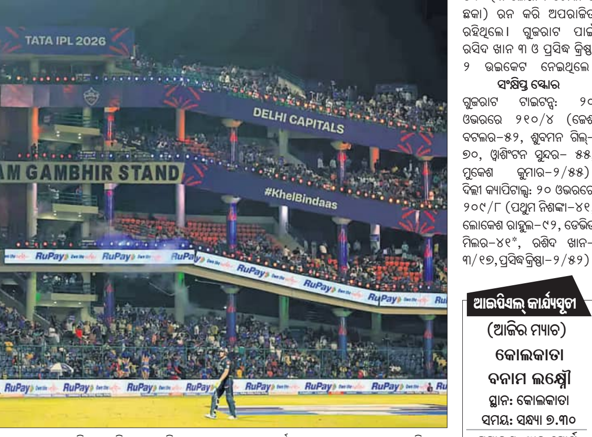
ଗୁଜରାଟ ଟାଇଟନ୍ସ-ଦିଲ୍ଲୀ କ୍ୟାପିଟାଲ୍ସ ଆଇପିଏଲ୍ ମ୍ୟାଚ ଅବସରରେ ଦର୍ଶକରେ ଭରା ଅରୁଣ ଜେଟଲୀ ଷ୍ଟାଡ଼ିୟମ ।

ବ୍ୟାଟିଂ କରିବା ପ୍ରଦର୍ଶନ ଓ ପରେ ରସିଦ୍ ଖାନଙ୍କ ଘାତକ ବୋଲି ବଳରେ ଏଠାରେ ରୁଧିବାର ଖେଳାଯାଇଥିବା ରୋମାଞ୍ଚିକ ଆଇପିଏଲ୍ ମ୍ୟାଚରେ ଗୁଜରାଟ ଟାଇଟନ୍ସ ୧ ରନରେ ଦିଲ୍ଲୀ କ୍ୟାପିଟାଲ୍ସକୁ ପରାସ୍ତ କରିଛି । ଦିଲ୍ଲୀ ଦ୍ୱାରା