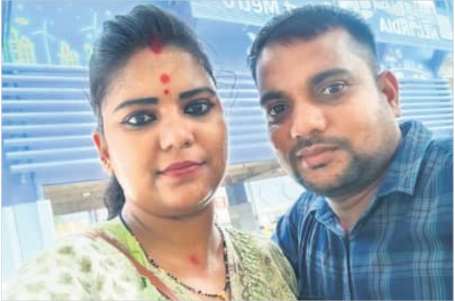
ରାଜପୁର, ୮୪ (ହର୍ଷବର୍ଦ୍ଧନ ବେହେରା)