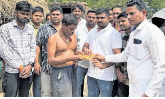
ଅଶ୍ରୁମାନ ମେମୋରିଆଲ ଗ୍ରନ୍ଥ କର୍ମକର୍ତ୍ତା ଆର୍ଥିକ ସହାୟତା ପ୍ରଦାନ କରୁଛନ୍ତି।