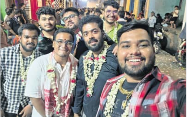
ରାଜପୁର, ୮୪ (ହର୍ଷବର୍ଦ୍ଧନ ବେହେରା)