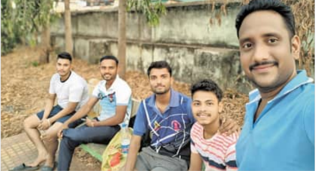
ରାଜପୁର, ୮୪ (ହର୍ଷବର୍ଦ୍ଧନ ବେହେରା)