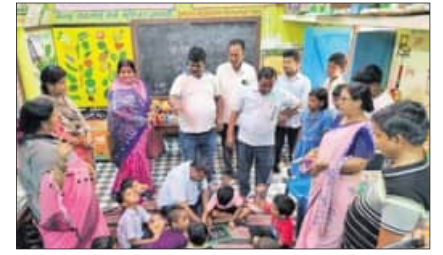
ବାଲିକୁଦା, ୮୪ (ତପସ ସାଲ)

ବାଲିକୁଦା ରୁକ୍ ଅନ୍ତର୍ଗତ ସଂଗ୍ରାମପୁର ପଞ୍ଚାୟତର ଛୁଇଁକାମୀ ଗ୍ରାମର ରାଧାକୃଷ୍ଣ ମନ୍ଦିର ପରିସରରେ ଅନନ୍ତ ଗୋଷ୍ଠୀମାନଙ୍କ ସଂଗଠନ ଆନୁକୂଲ୍ୟରେ ବାର୍ଷିକ କାଠି ଲଢ଼ି ଉତ୍ସବ ଅନୁଷ୍ଠିତ ହୋଇଯାଇଛି। କରତ୍ୟକ୍ତପୁର ଜିଲାର ବିଭିନ୍ନ ଅଞ୍ଚଳର କାଠି ଲଢ଼ି ଦଳ ଛୁଇଁକାମୀ, ହରିଶପୁର, ଖଣ୍ଡାସାହି, ନାକୋଳି, ଦଣ୍ଡାସାହି, ନରଗପୁର ଆଦି ପ୍ରଭୃତି ଅଞ୍ଚଳରୁ ଲଢ଼ି ସଙ୍ଗଠନମାନେ ଯୋଗଦେଇ ସେମାନଙ୍କର ପାରମ୍ପରିକ ଲଢ଼ି ଖେଳ ପ୍ରଦର୍ଶନ କରିଥିଲେ। ଏହି କାର୍ଯ୍ୟକ୍ରମରେ ଉତ୍ତମ ପ୍ରଦର୍ଶନ କରିଥିବା ପ୍ରଭୃତି ଅଞ୍ଚଳରୁ ଲଢ଼ି ସଙ୍ଗଠନମାନେ ଯୋଗଦେଇ ସେମାନଙ୍କର ପାରମ୍ପରିକ ଲଢ଼ି ଖେଳ ପ୍ରଦର୍ଶନ କରିଥିଲେ। ଏହି କାର୍ଯ୍ୟକ୍ରମରେ ଉତ୍ତମ ପ୍ରଦର୍ଶନ କରିଥିବା ପ୍ରଭୃତି ଅଞ୍ଚଳରୁ ଲଢ଼ି ସଙ୍ଗଠନମାନେ ଯୋଗଦେଇ ସେମାନଙ୍କର ପାରମ୍ପରିକ ଲଢ଼ି ଖେଳ ପ୍ରଦର୍ଶନ କରିଥିଲେ।