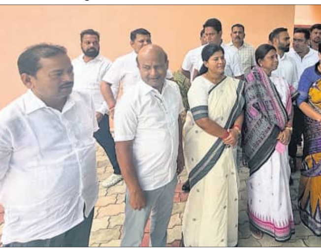
ଏସପିଙ୍କୁ ଭେଟିବାକୁ ଆସିଥିବା ବିଜେଡି ନେତୃମଣ୍ଡଳୀ।